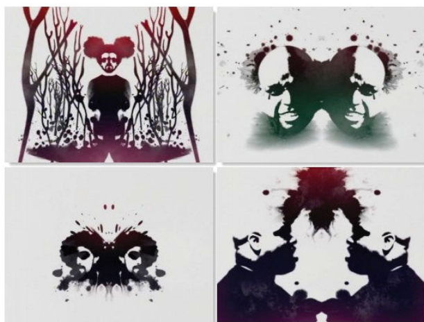
تصویر شماره ۲- قسمتهایی از ویدیوی Crazy