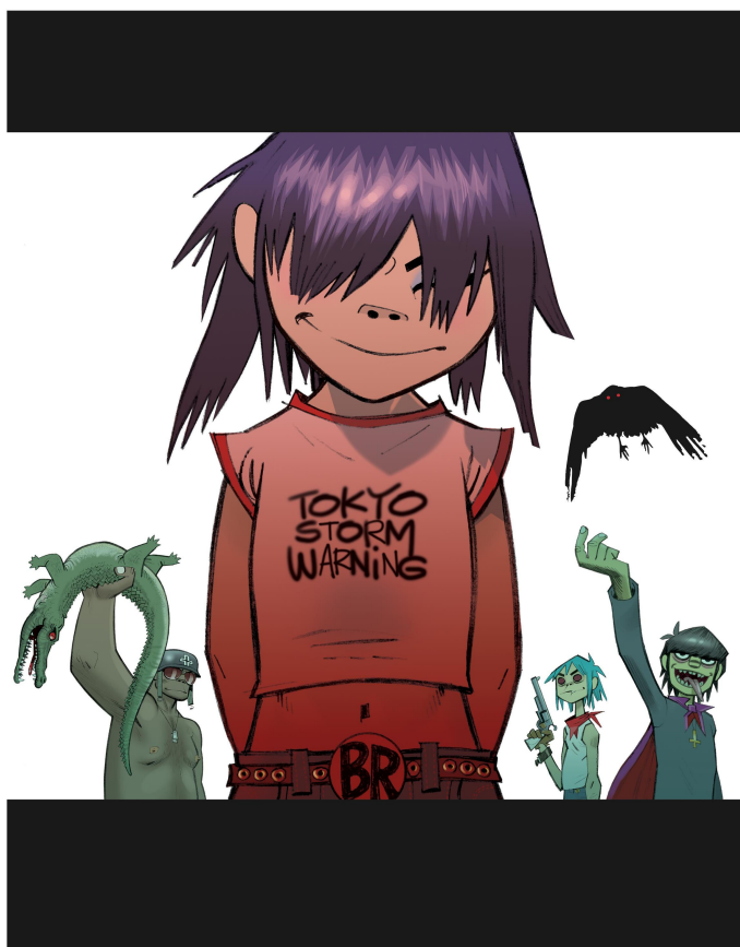
تصویر شماره ۳- کاراکترهای گروه گوریللاز

در میان ژانرهای مختلف نماآهنگ ها، کلیپ های انیمیشنی بیشتر مورد توجه قرار گرفته اند و در همذات پنداری با مخاطب موفق تر عمل می نمایند که با پیشرفت تکنیکهای دنیای انیمیشن این ارتباط عمیق تر هم گردیده است. " کلیپ های انیمیشنی، ویدیوهایی از تصاویر متحرکی شامل خواننده یا اعضای گروه موسیقی را به نمایش میگذارند که بعضاً حتی کاراکترهای رئال هم حضور ندارند. برای نمونه می توان به ویدیوهای گروه گوریللاز (Gorillaz) به کارگردانی جیمی هیولت (Jamie Hewlett) و ویدیوی دیوانه (Crazy) از نارلز بارکلی (Gnarls Barkley) اشاره نمود." (M. Schwartz,2007,p.101)